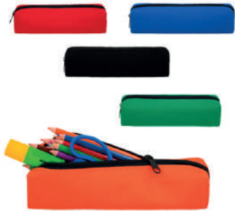
Lapicera rectangular de poliéster.