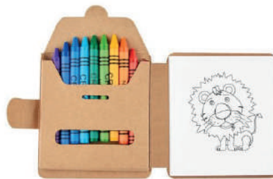
Libreta con 40 hojas, 12 hojas con dibujos de animales y 28 hojas blancas.