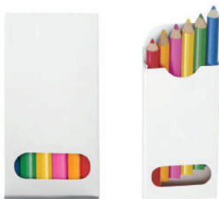
Caja de cartón con 6 colores cortos.