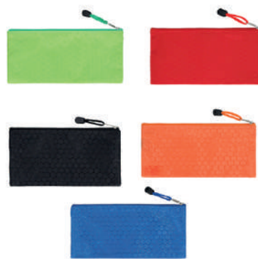
Lapicera de poliéster con cierre.