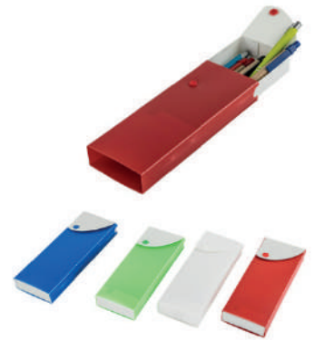
Lapicera de plástico con broche.