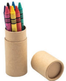
Estuche de cartón con 8 crayones de varios colores.